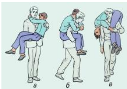
Рис. 25. Переноска пострадавшего одним носильщиком: а - на руках; б - на спине; в - на плече.

Пострадавший свободной рукой может опираться на палку. При невозможности самостоятельного передвижения пострадавшего и отсутствии помощников возможна транспортировка волоком на импровизированной волокуше - на брезенте, плащ-палатке.