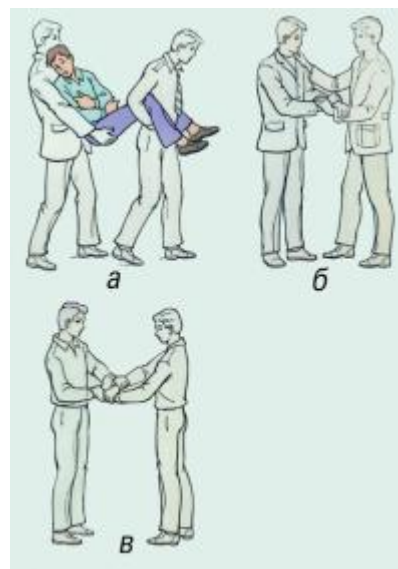
Рис. 26. Переноска пострадавшего двумя носильщиками: а - способ "друг за другом"; б - "замок" из трех рук; в - "замок" из четырех рук.

Очень часто правильно созданное положение спасает жизнь раненого и, как правило, способствует быстрейшему его выздоровлению. Транспортируют раненых в положении лежа на спине, на спине с согнутыми коленями, на спине с опущенной головой и приподнятыми нижними конечностями, на животе, на боку. В положении лежа на спине транспортируют пострадавших с ранениями головы, повреждениями черепа и головного мозга, позвоночника и спинного мозга, переломами костей таза и нижних конечностей. В этом же положении необходимо транспортировать всех больных, у которых травма сопровождается развитием шока, значительной кровопотерей или бессознательным состоянием, даже кратковременным, больных с острыми хирургическими заболеваниями (аппендицит, ущемленная грыжа, прободная язва и т.д.) и повреждениями органов брюшной полости.